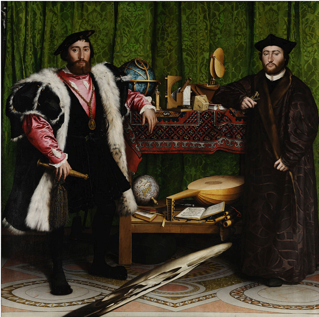
Hans Holbein, The Ambassadors , 1533. Հանս Հոլբայն, Դեսպանները, 1533 թ.

You are allowed to use phone or computer-based translation for this assignment. If you do, please send the results to your teacher.