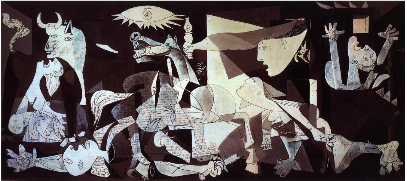
Pablo Picasso, Guernica , 1937.