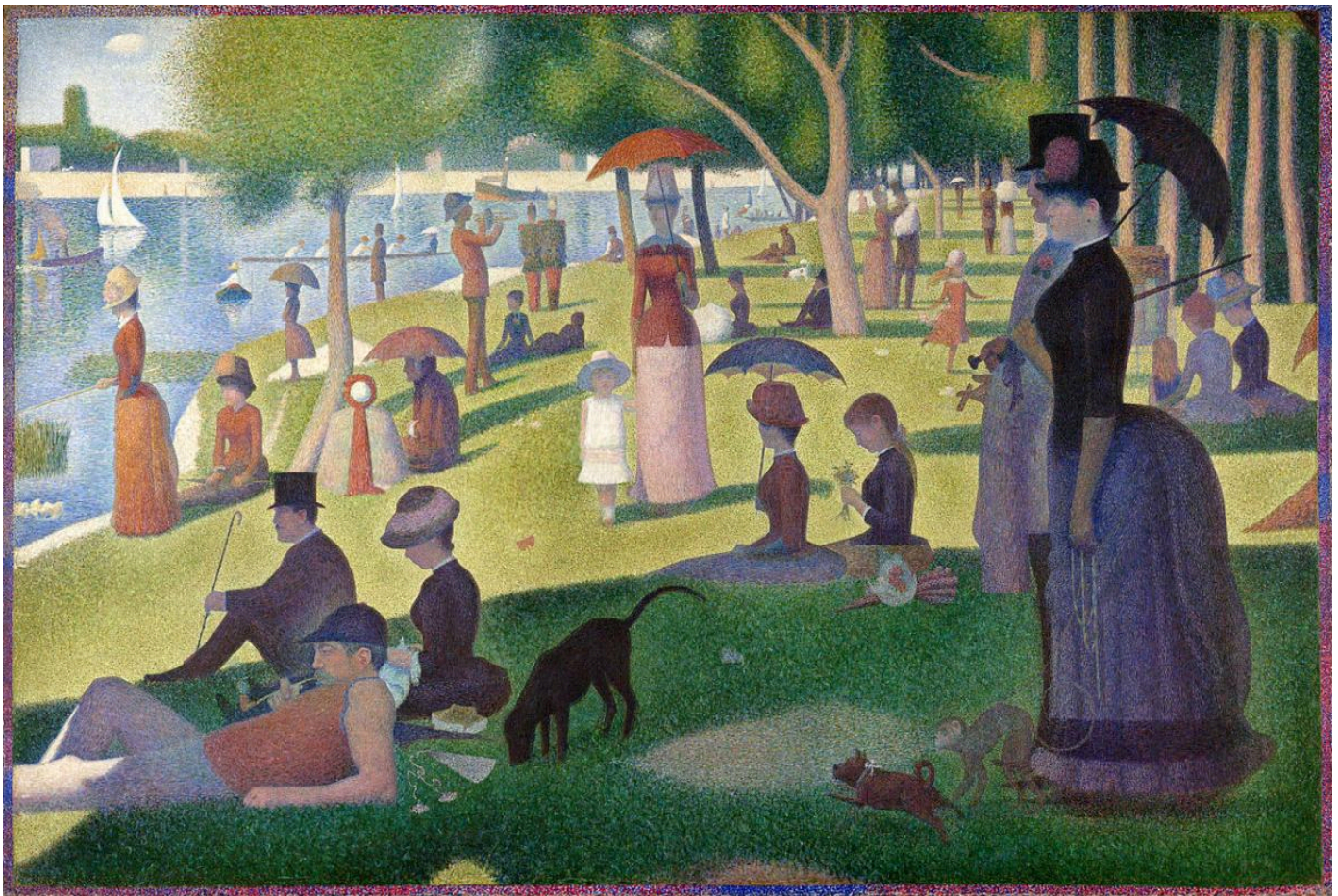
Georges-Pierre Seurat, A Sunday Afternoon on the Island of La Grande Jatte , 1884–1886 ጆርጅ-ፒየር ሴሩት፡ በላ ግራንዴ ጃቲ ደሴት እሁድ ከሰዓት፡ 1884–1886።

You are allowed to use phone or computer-based translation for this assignment. If you do, please send the results to your teacher.